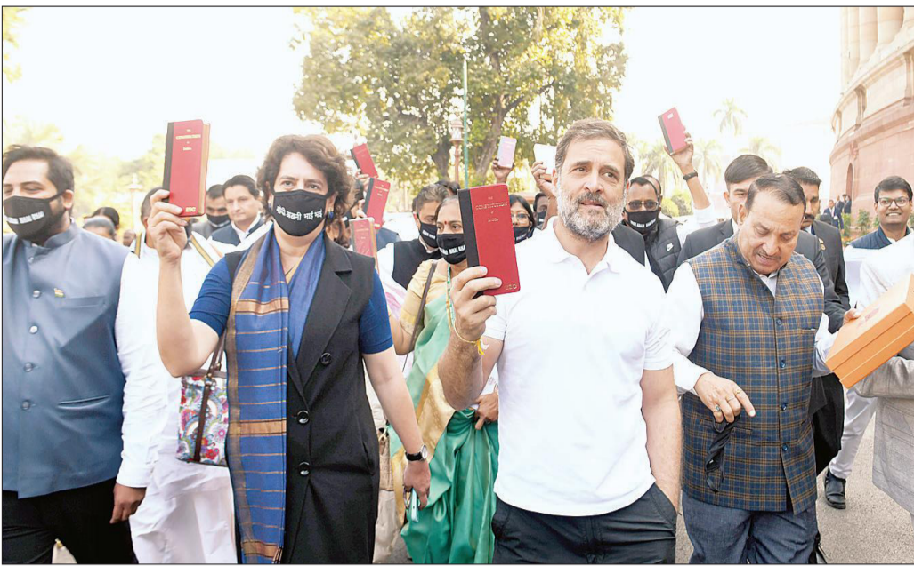
शुक्रवार को नई दिल्ली में संसद के शीतकालीन सत्र के दौरान अडानी मुद्दे पर विरोध मार्च में शामिल हुए लोकसभा में विपक्ष के नेता राहुल गांधी कांग्रेस सांसद प्रियंका गांधी और अन्य सांसद।