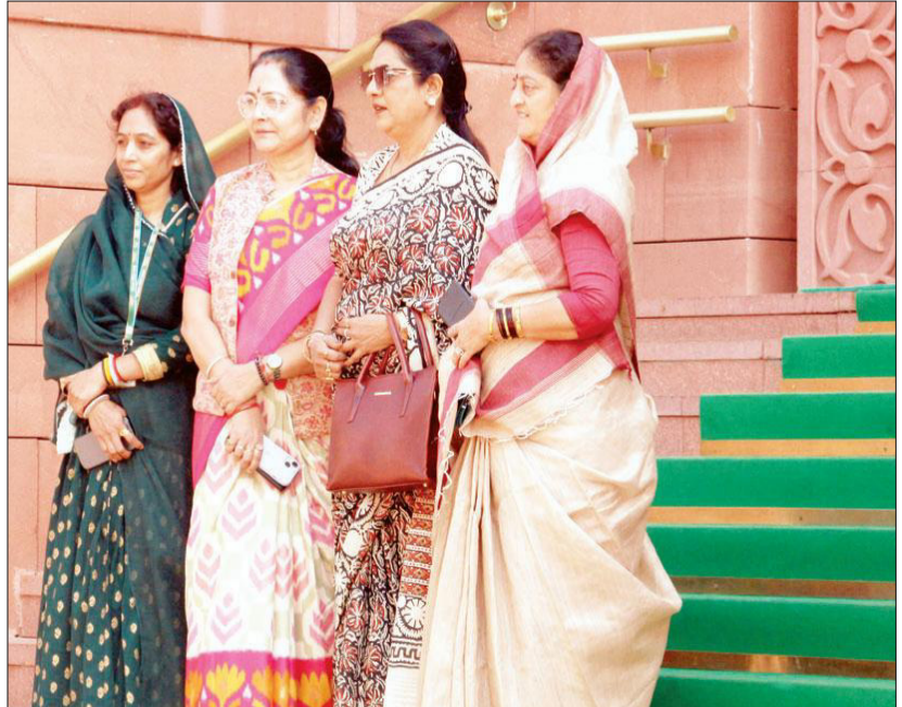
नई दिल्ली में शुक्रवार को संसद के शीतकालीन सत्र के दौरान संसद भवन के बाहर खड़े सांसद।

रात के तापमान में गिरावट देखी गई और शुक्रवार को तापमान शून्य से 4.4 डिग्री सेल्सियस नीचे दर्ज किया गया, जबकि पिछली रात शून्य से 2.7 डिग्री सेल्सियस नीचे दर्ज किया गया था और यह सामान्य से 3.2 डिग्री सेल्सियस कम था। कुम्वाड़ा में न्यूनतम तापमान पिछली रात तापमान शून्य से 2.5 डिग्री सेल्सियस के मुकाबले 3.4 डिग्री सेल्सियस तक गिर गया। मौसम की इस अवधि के दौरान सीमांत कश्मीर जिले में तापमान सामान्य से 1.7 डिग्री सेल्सियस कम रहा। कोकरनाग में पिछली रात के शून्य से 1.4 डिग्री सेल्सियस कम तापमान के मुकाबले शून्य से 2.4 डिग्री सेल्सियस कम तापमान दर्ज किया गया, जो सामान्य से 1.8 डिग्री सेल्सियस कम रहा।