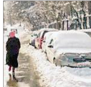
और कोनीबल जैसे लोकप्रिय पर्यटन स्थलों में ठंड और भी अधिक रही, जहां पारा तेजी से गिरा और न्यूनतम तापमान क्रमशः शून्य से 6.5 डिग्री

जम्मू-कश्मीर स्थित कश्मीर घाटी में लगातार जारी ठंड ने अपना शिकंजा और कस लिया है। अधिकारियों ने बताया कि शुक्रवार को श्रीनगर में इस मौसम की सबसे ठंडी रात दर्ज की गई, जहां तापमान शून्य से 4.1 डिग्री सेल्सियस नीचे दर्ज किया गया।